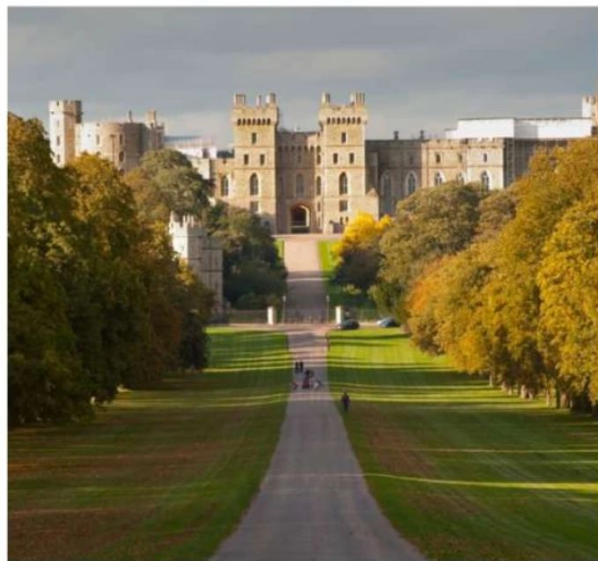
Excursion to Windsor Castle