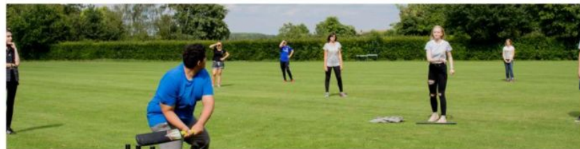
Students playing cricket