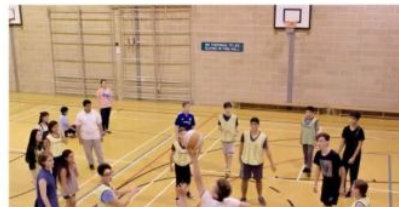
Students playing basketball