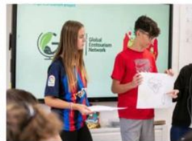
Students presenting in class