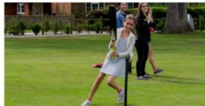
Students playing rounders