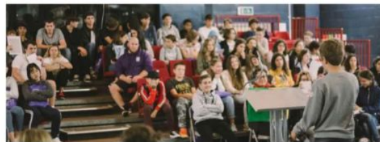
Student presenting in LWC